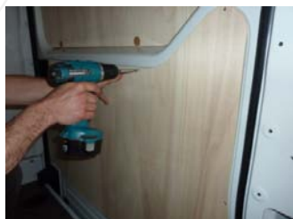
Placez & vissez la partie basse de La porte latérale 10 vis 4x30