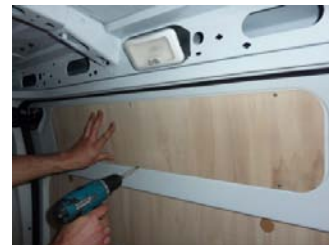
Placez & vissez la partie haute de la Porte latérale 6 vis 4x30