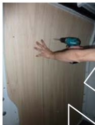
Placez & vissez le côté AV Gauche 11 vis 4x30