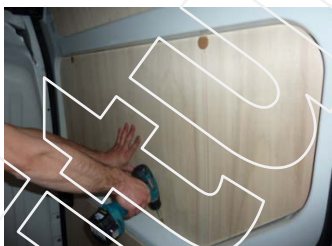
Placez & vissez la partie centrale de La porte latérale 4 vis 4x30