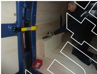
Placez et vissez le passage de roue Gauche 6 vis 4x30