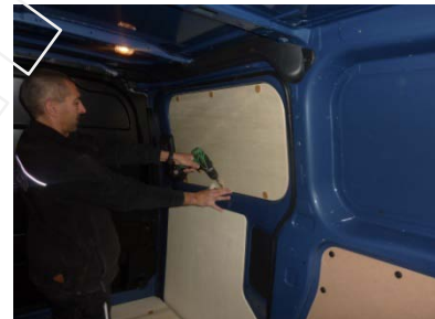
Placez et vissez la porte latérale Partie haute 6 vis 4x25