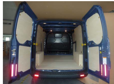
Votre Kit Utilitaire est posé !

NOTRE RESPONSABILITE NE SAURAIT ETRE ENGAGEE SUITE AU NON-RESPECT DES INSTRUCTIONS CI-DESSUS