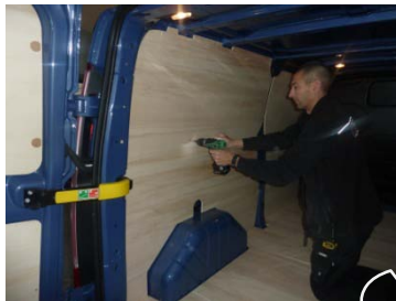
Placez & vissez le côté AR Gauche 8 vis 4x25