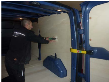
Placez & vissez le côté AR Droit 8 vis 4x25