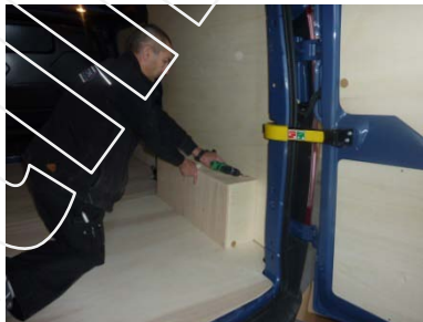
Placez et vissez le passage de roue Droit 6 vis 4x30