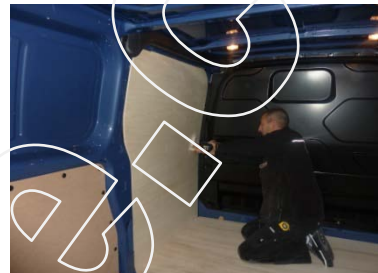
Placez & vissez le côté Av Gauche 8 vis 4x25