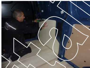
Placez et vissez la porte latérale Partie basse 8 vis 4x25