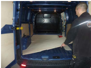
Placez & vissez le Plancher 15 vis 4x25