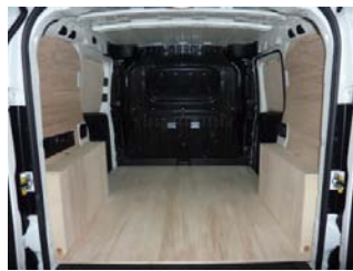
Votre Kit Utilitaire est posé !

NOTRE RESPONSABILITE NE SAURAIT ETRE ENGAGEE SUITE AU NON-RESPECT DES INSTRUCTIONS CI-DESSUS