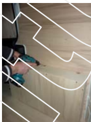
Placez et vissez le passage de roue Droit 7 vis 4x30