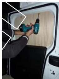
Placez et vissez la porte latérale Partie haute 4 vis 4x25