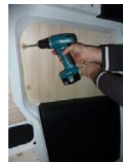
Placez & vissez le côté AV Gauche 4 vis 4x25