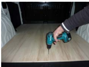
Placez & vissez les deux parties De plancher 9 vis 4x30