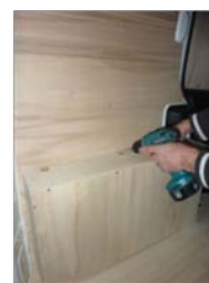
Placez et vissez le passage de roue Gauche 7 vis 4x30