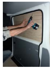
Placez et vissez la porte latérale Parties haute & basse 10 vis 4x25