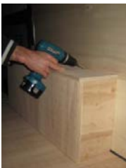
Placez et vissez le passage de roue Droit 7 vis 4x30