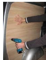
Placez & vissez le côté AR Gauche 8 vis 4x25