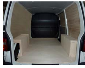
Votre Kit Utilitaire est posé !

NOTRE RESPONSABILITE NE SAURAIT ETRE ENGAGEE SUITE AU NON-RESPECT DES INSTRUCTIONS CI-DESSUS