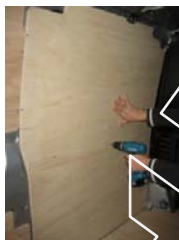
Placez & vissez le côté AV Gauche 7 vis 4x25