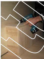
Placez et vissez le passage de roue Gauche 6 vis 4x30