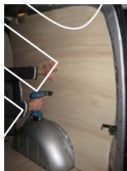
Placez et vissez le côté AR Droit 6 vis 4x25