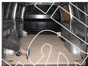
Placez & vissez le Plancher AR 6 vis 4x25