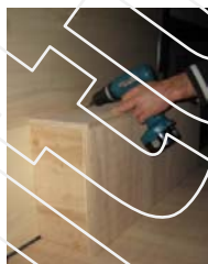
Placez et vissez le passage de roue Gauche 4 vis 4x30