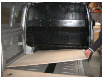
Placez & vissez le Plancher AV 6 vis 4x25