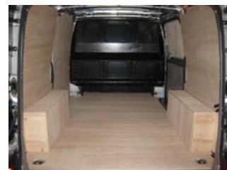
Votre Kit Utilitaire est posé !

NOTRE RESPONSABILITE NE SAURAIT ETRE ENGAGEE SUITE AU NON-RESPECT DES INSTRUCTIONS CI-DESSUS