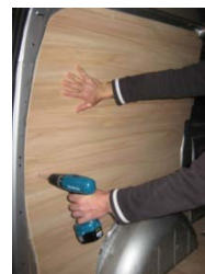
Placez & vissez le côté AR Gauche 9 vis 4x25