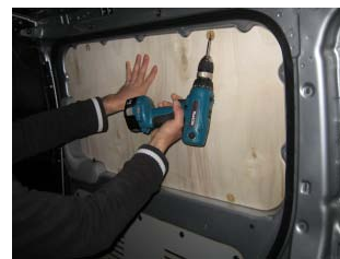
Placez et vissez la porte latérale Partie haute 4 vis 4x25