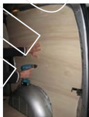
Placez et vissez le côté AR Droit 8 vis 4x25