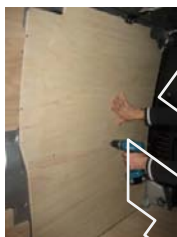
Placez & vissez le côté AV Gauche 7 vis 4x25