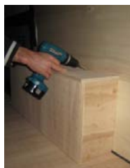
Placez et vissez le passage de roue Droit 4 vis 4x30