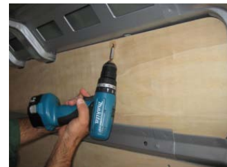
Placez & vissez la partie haute côté Droit 4 vis 4x25

NOTRE RESPONSABILITE NE SAURAIT ETRE ENGAGEE SUITE AU NON-RESPECT DES INSTRUCTIONS CI-DESSUS