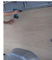
Placez et vissez le côté AR Droit 14 vis 4x25