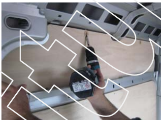
Placez & vissez les parties Hautes Côté gauche 6 vis 4x25