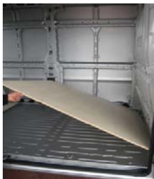
Placez & vissez le Plancher AV 8 vis 4x25