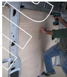
Placez & vissez le côté AV Gauche 9 vis 4x25