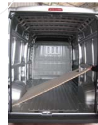
Placez & vissez le Plancher AR 10 vis 4x25