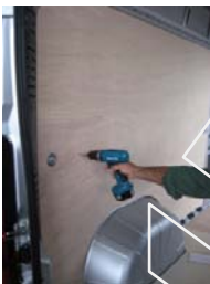
Placez & vissez le côté AR Gauche 14 vis 4x25