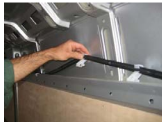
Déclipsez les agrafes Côté AR droit