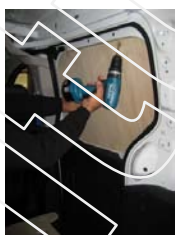
Placez et vissez la porte latérale Partie haute 4 vis 4x25