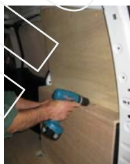
Placez et vissez le passage de roue Droit 8 vis 4x30