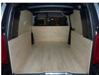
Votre Kit Utilitaire est posé !

NOTRE RESPONSABILITE NE SAURAIT ETRE ENGAGEE SUITE AU NON-RESPECT DES INSTRUCTIONS CI-DESSUS