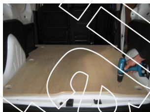
Vissez le Plancher 6 vis 4x25