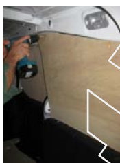
Placez & vissez le côté AR Droit 4 vis 4x25