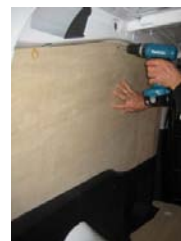
Placez & vissez le côté Gauche 6 vis 4x25