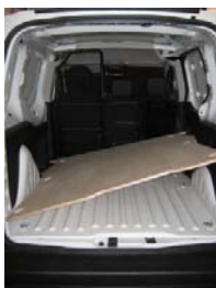
Placez, de biais le Plancher