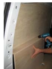
Placez et vissez le passage de roue Gauche 8 vis 4x30